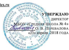
ГРАФИК аттестации педагогических работников на соответствие занимаемой должности в 2018-2019 учебном году